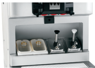
Opción de riel de jarabe integrado 2 a temperatura ambiente con tapas y cucharones, 2 calentados con bombas de jarabe