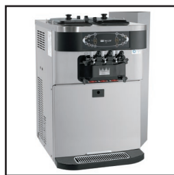
Ilustrada com direcionador de ar opcional.

Ilustração com carrinho de altura padrão (o carrinho é opcional)