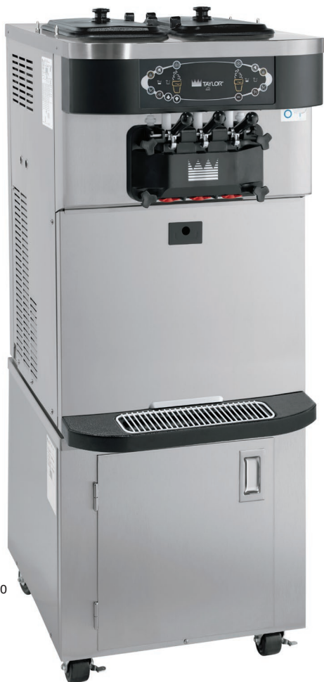
Ilustração com carrinho de altura padrão (o carrinho é opcional)