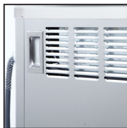
显示标准 拉出式把手