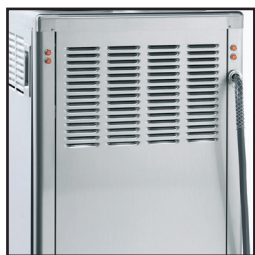
显示可选 后原料灯