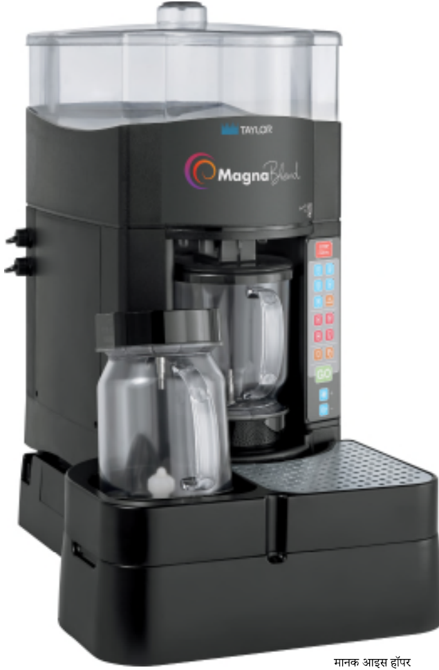
मानक आइस हॉपर के साथ दिखाया गया है