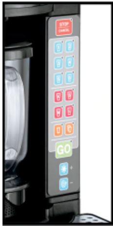
केवल अन्तरराष्ट्रीय मॉडल पर 6 रेसिपी बटन के साथ दिखाया गया है

अधिक तेज़, अधिक स्मार्ट तथा बेहतर — भविष्य की प्रौद्योगिकी वाला त्वरित सेवा ब्लेंडर अब आपके लिए उपलब्ध है। इसे प्रत्येक तरीके से सेवा की गति बढ़ाने के लिए डिज़ाइन किया गया है, MagnaBlend कार्य कुशलता को तो हम जानते ही हैं।